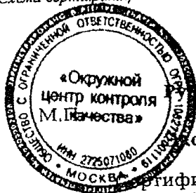
Схема сертификации 7