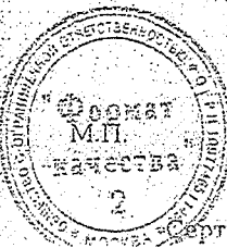
Схема сертификации 7.