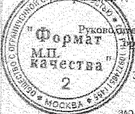
Схема сертификации 7.

Руководитель (заместитель руководителя) Органа по сертификации