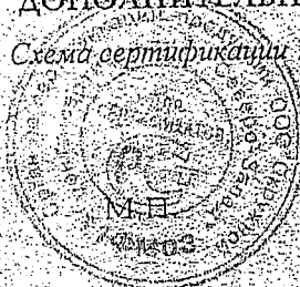
Схема сертификации 7 (седьмая)